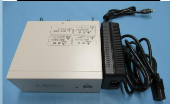
DG3000EX-II + AC アダプタ