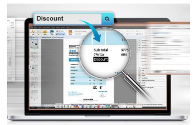
同梱ソフトで日本語のOCRに対応。