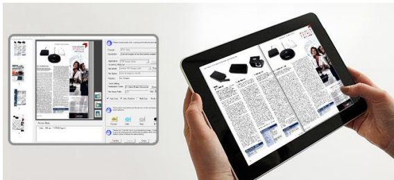
付属ソフトBook Pavilionでスキャン画像から電子書籍(PDFファイルなど)を作成することが出来ます。