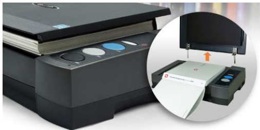
原稿台カバーは持ち上げることが出来、厚い書籍でもしっかりと押さえつけることが可能です。