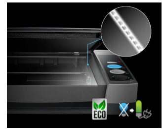
光源にLEDを採用。立ち上がり早く紙へのダメージが少ない。