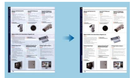
裏写りを軽減する補正機能を搭載。