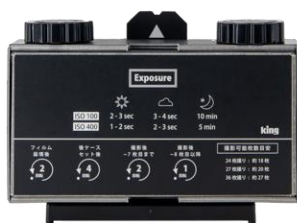
King ピンホールフィルムカメラ KPC-135